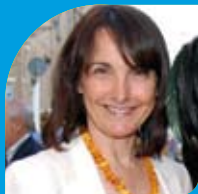
Luana Angeloni Sindaco di Senigallia Mayor of Senigallia

La pratica sportiva é in continua espansione a tutte le latitudini, in ogni parte del mondo.